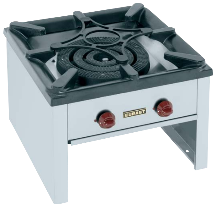
> Mod. HGR2 + 1 Ud. (492002C)