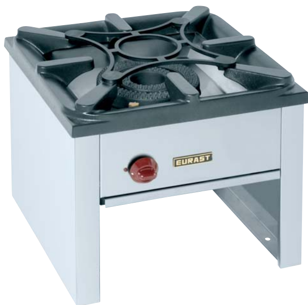
> Mod. HGR + 1 Ud. (492002C)

D Edelstahlkonstruktion 18/10 AISI-304. Mit einem robusten, 600x600 oder 700x700 mm großen (je nach Modell), in schwarz glasemaillierten Gusseisenrost ausgestattet. Einzelhähne mit Sicherheitsventil, mit max/min-Dauerleuchte. Mit unterem, frontal herausnehmbarem Fett-Auffangkasten. Modell 4920 mit 2 unabhängig voneinander funktionierenden Rundbrennern. Modell 4930 mit 3 Rundbrennern (die 2 inneren vereinen sich) und 2 voneinander unabhängigen Zündungen. Es ist wahlweise ein reduzierendes Rostmodell verfügbar, welches auf den Gusseisenrost platziert wird (Kode 492002C).