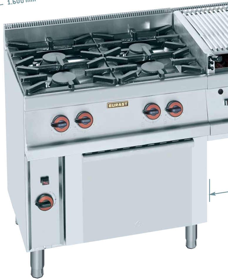
> Mod. 2M SYSTEM (Gama 600)