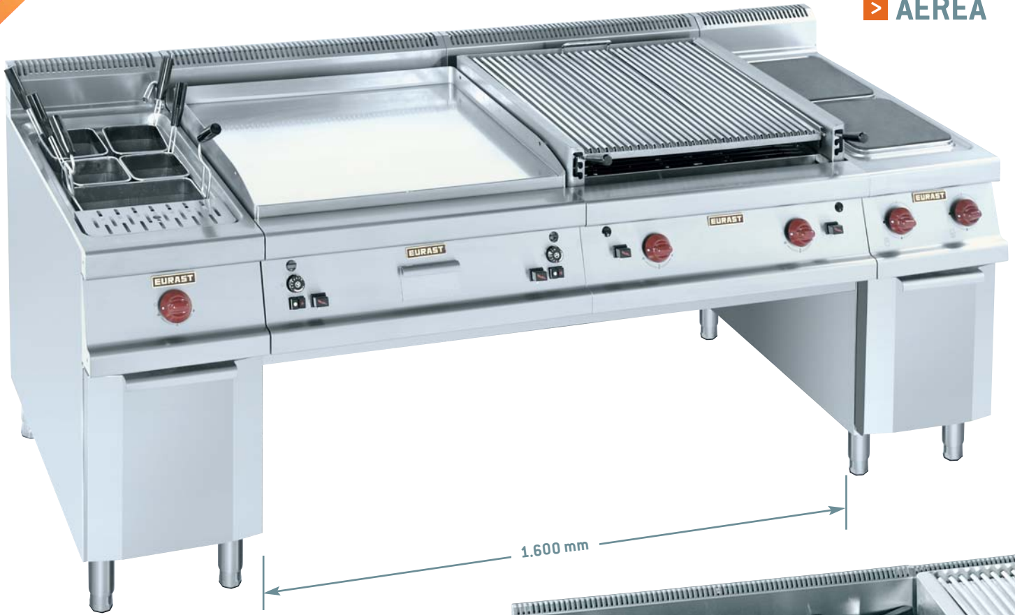
> Mod. 2M SYSTEM (Gama 900)